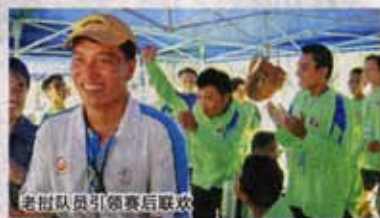
▲老船队员引领赛后联欢