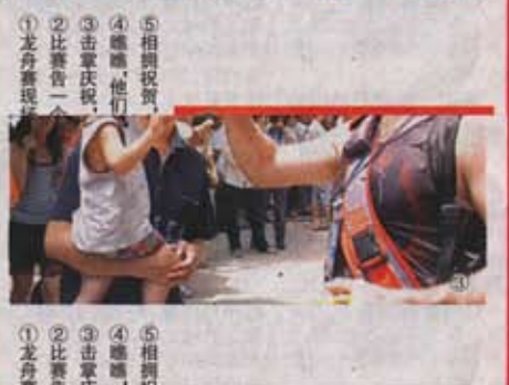
①龙舟赛现场 ②比赛赛况 ③击掌庆祝 ④助威, 他们 ⑤相拥祝贺