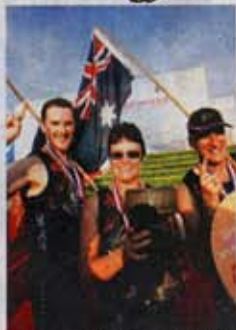
▲“意外”夺冠，让因为好玩而划龙舟的澳洲队更开心