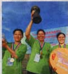
▲下楞村巾幗好手一枝独秀