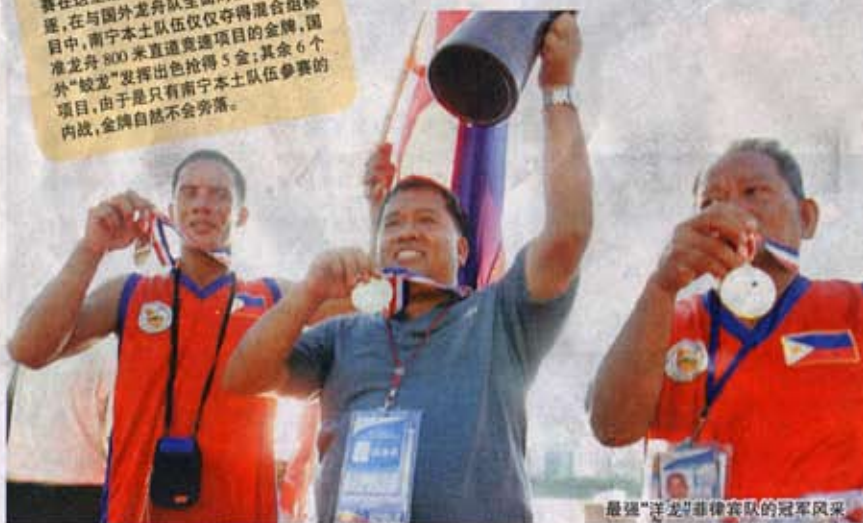
最强“洋龙”菲律宾队的冠军风采

本报讯 6月20日下午，南宁南湖下湖岸边一片欢声笑语，2007年全国龙舟月暨第四届中国南宁国际龙舟邀请赛在这里落下帷幕。经过两天激烈的角逐，在与国外龙舟队全面对抗的6个项目，南宁本土队伍仅仅夺得混合组标准龙舟800米直道竞速项目的金牌，国外“蛟龙”发挥出色夺得5金；其余6个项目，由于是只有南宁本土队伍参赛的内战，金牌自然不会旁落。