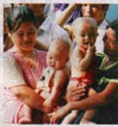
▲精彩龙舟赛引来可爱小观众